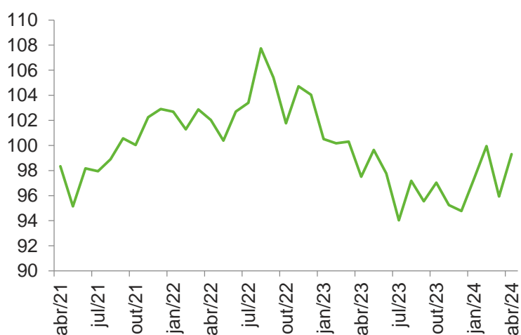
Índice de desempenho industrial (IDI-RS) (Índice de base fixa mensal - 2006=100)

Com exceção do emprego, que ficou estável (+0,1%), todos os componentes do IDI/RS cresceram na passagem de março para abril. O faturamento real foi o componente mais impactado pelo calendário, avançando 12,5% na comparação com o mês de março. Além dos dias úteis, minimizado pelo método de ajuste sazonal, a base de comparação baixa de março (-6,6% ante fevereiro), quando atingiu o menor patamar desde agosto de 2020, ajudou a impulsionar o resultado. Também cresceram em relação a março, as compras industriais (+1,5%), a utilização da capacidade instalada (+1,5 p.p.), que atingiu 80,9%, a massa salarial real (+0,8%) e as horas trabalhadas na produção (+0,6%).